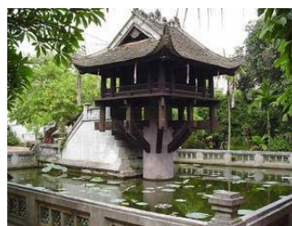
Chùa Một Cột