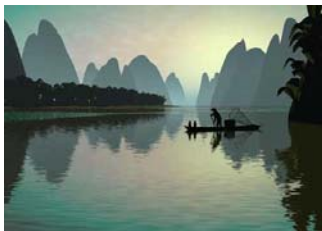
Vịnh Hạ Long

(Bài 22 trong sách Giáo Khoa Việt Ngữ- Cấp Ba)