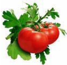
Cà chua (Tomato)