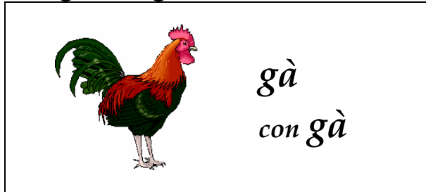
Con gà bới đất