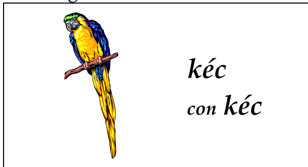
Con kéc tập nói