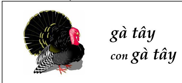
Đuôi của con gà tây xòe ra