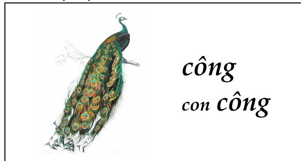
Con công xòe lông