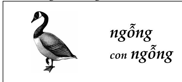
Con ngỗng lội nước