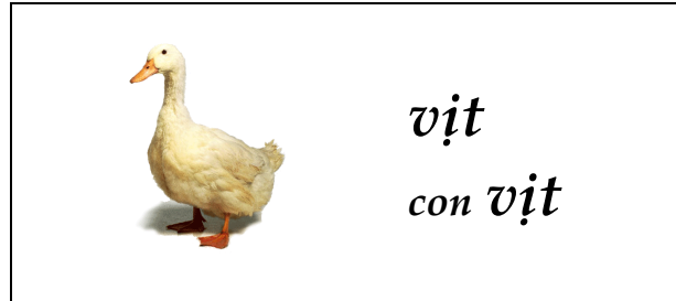
Con vịt lội nước