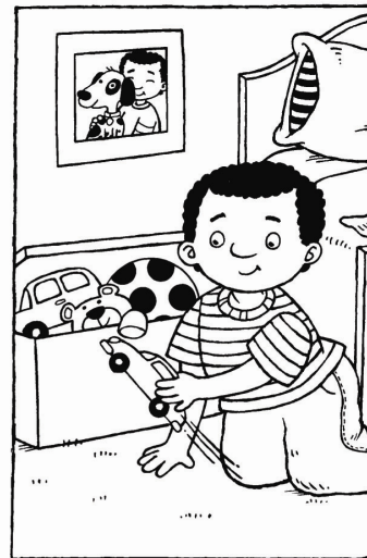
Quân cất đồ chơi đi.