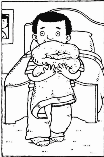
Quân cất chăn đi.