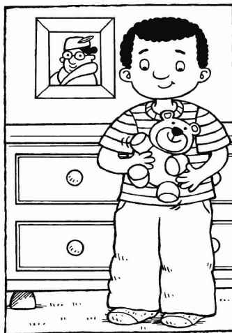
Quân cất con gấu bông đi.