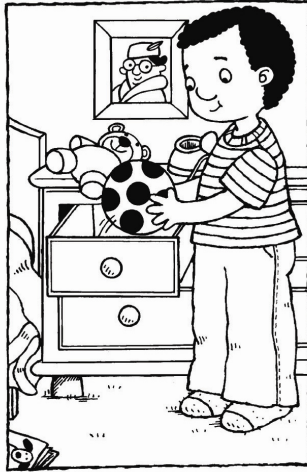
Quân cất trái banh đi.