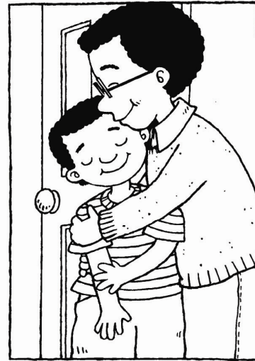
Phòng của Quân bây giờ thật ngăn nắp.