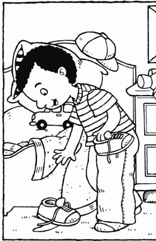
Quân cất đôi giày đi.