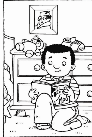
Quân cất quyển sách đi.