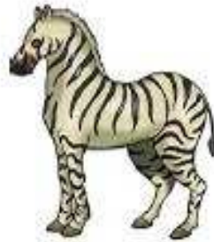
Ngựa vằn a zebra