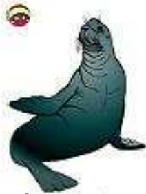
Chó biển a seal