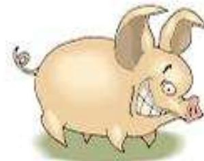
Con heo a pig