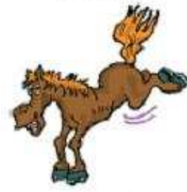
Con ngựa a horse