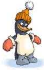
Chim cánh cụt a penguin