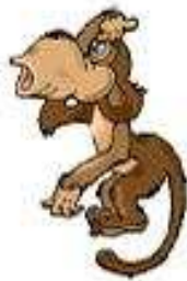
Con khỉ a monkey