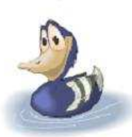
Con vịt a duck