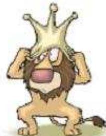
Con sư tử a lion