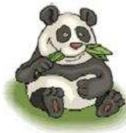
Con gấu trúc a panda