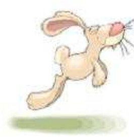
Con thỏ a rabbit