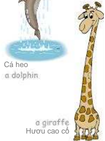
a giraffe Hươu cao cổ