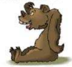
Con gấu a bear