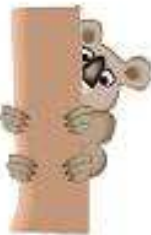
Gấu túi a koala