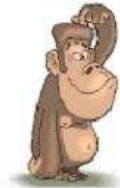
Con khỉ a gorilla