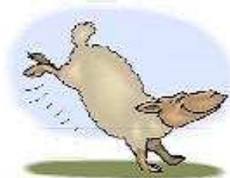
Con cừu a sheep