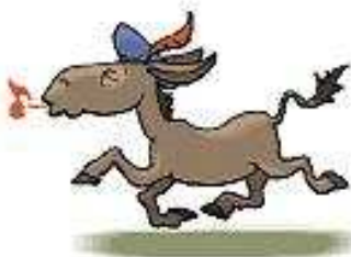
Con lừa a donkey