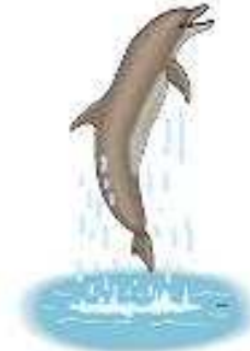
Cá heo a dolphin