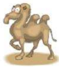
Con lạc đà a camel