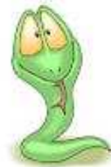
Con rắn a snake