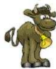
Con bò a cow