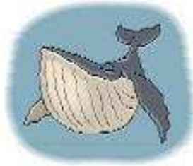
Cá voi a whale