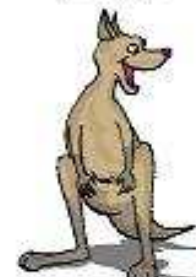
Con chuột túi a kangaroo