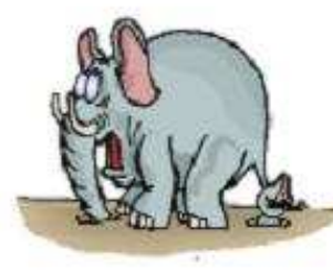
Con voi a elephant