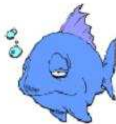
Con cá a fish