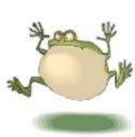
Con ếch a frog