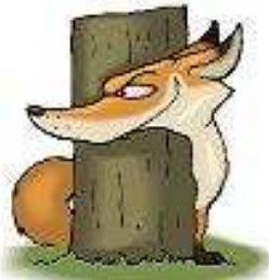
Con cáo a fox