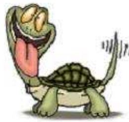
Con rùa a turtle