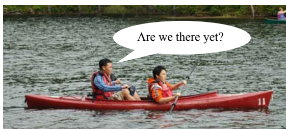
Thuyền ơi có nhớ bến chăng Bến thì một dạ khăng khăng đợi thuyền...