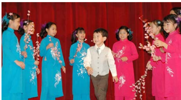
Tám cô công chúa và một hoàng tử của ban vũ Lạc Hồng