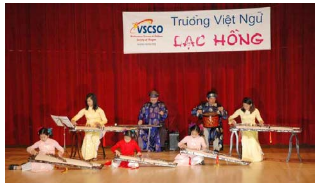
Hòa âm đặc sắc với tiếng đàn tranh, đàn bầu và tiếng trống quê hương