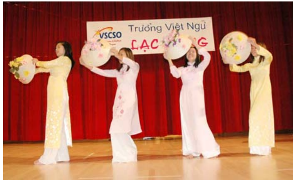
Ban vũ do các em học sinh lớn.. đậm đà màu sắc dân tộc