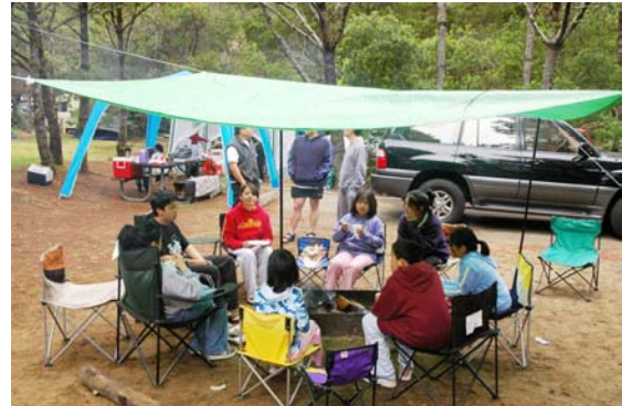
Lửa trại dưới mưa