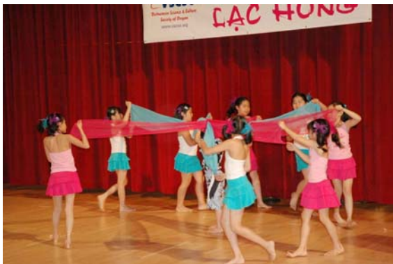
Ban vũ do các em nhỏ trình diễn thật dễ thương