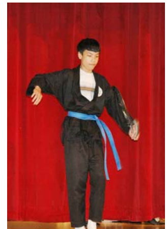
Quyền Tây Sơn của võ phái Kim Sơn