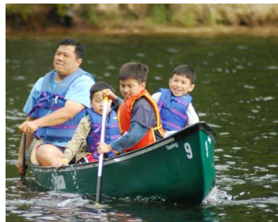
Lái đại, mũi chịu đòn