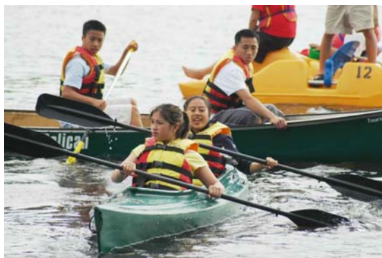
Traffic jam! ... Hội SAS tham dự trại hè với trường Lạc Hồng