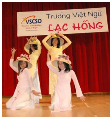
Nữ học sinh trong những chiếc áo dài tha thướt và những chiếc nón lá bài thơ