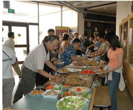
..buổi liên hoan đơn sơ mà ngon miệng