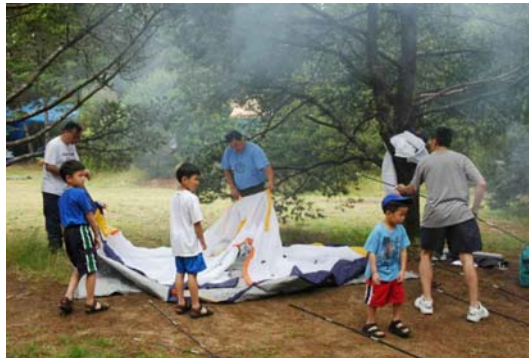
Where are the poles? Dựng lều