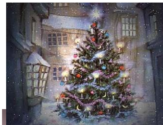
những dây đèn có hình dạng như những giọt nước rơi

Đến ngày lễ, gia đình em tụ tập đông đủ từ ông bà nội ngoại đến cô bác cậu mợ dì và các anh chị em họ cùng bạn bè. Bữa tiệc Giáng Sinh của hầu hết những gia đình Việt nam đều có những món như: