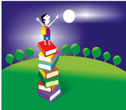
một kho tàng vô giá

niềm vui khi cầm một quyển truyện và đọc mê mết, và hy vọng là các em đọc thêm sách với nhiều genres khác nhau để trau dồi thêm kiến thức, Trong những năm qua, phong trào đọc "Harry Potter" đã đem lại sự yêu thích