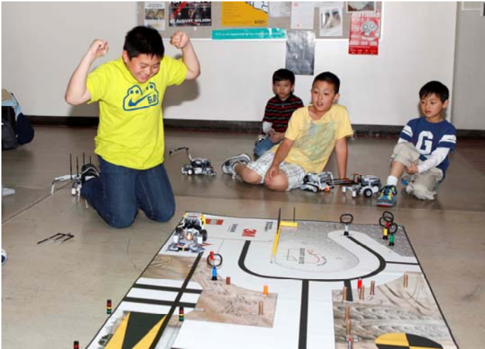
Yeah! I did it!