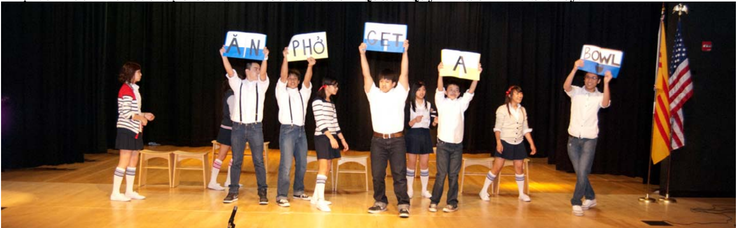
Đội vũ “Unforgettable” -Đội vũ không những rất tài giỏi mà lại có a cute sense of humour.