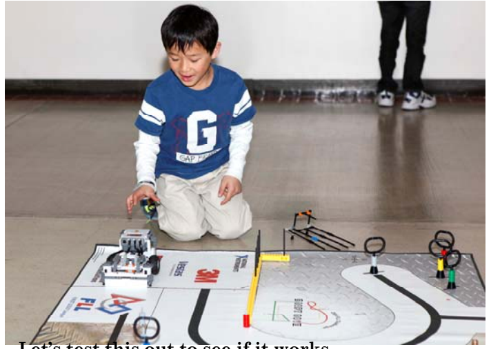
Let's test this out to see if it works