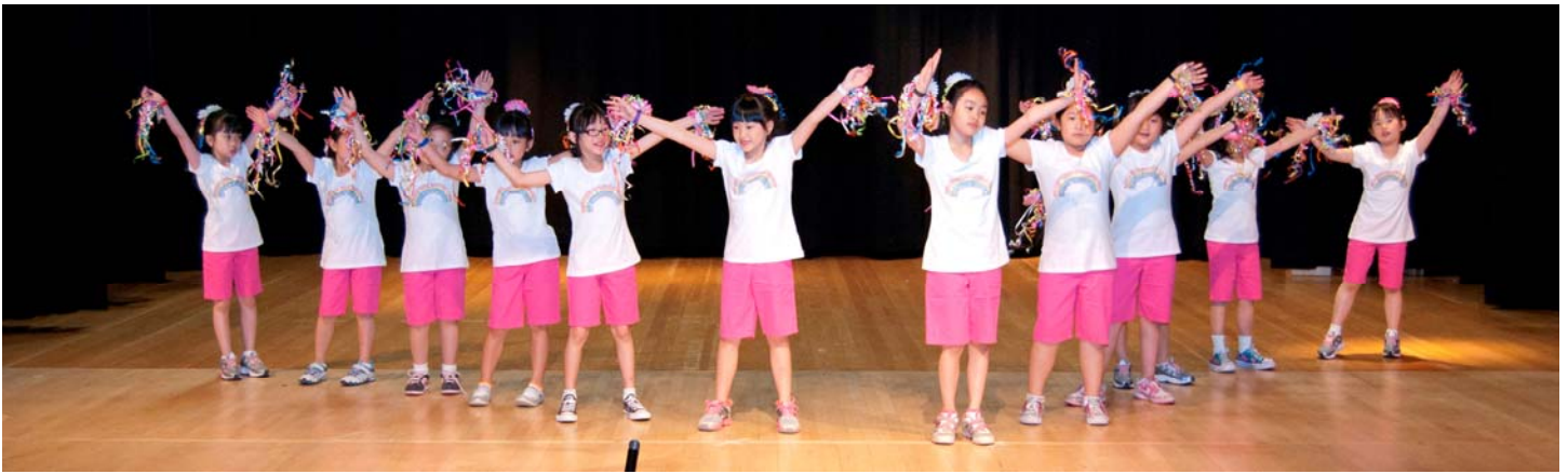
Đội vũ “Mầm Non” cố gắng tập vượt để theo kịp hai đội vũ của các chị lớn.