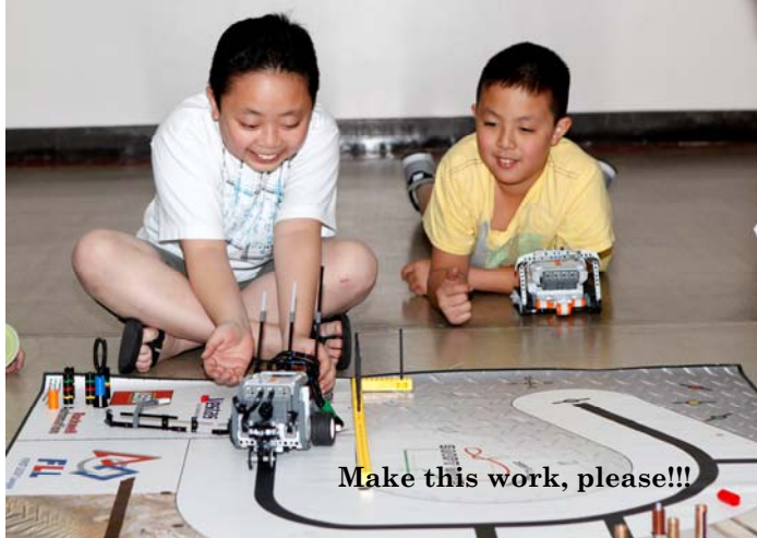
Make this work, please!!!