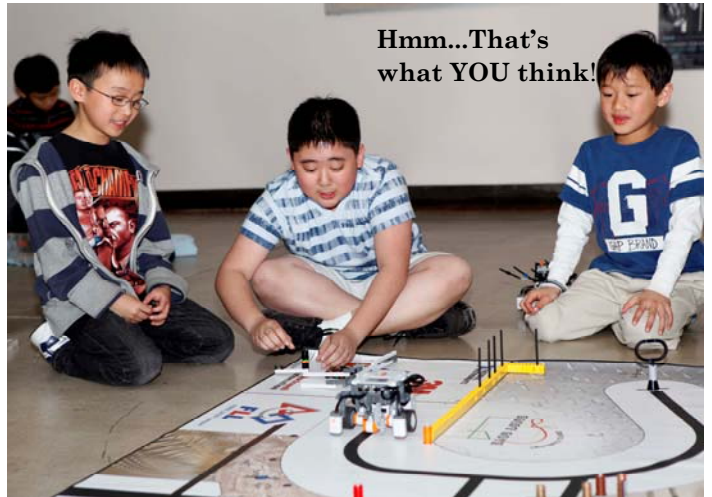
Hmm...That's what YOU think!