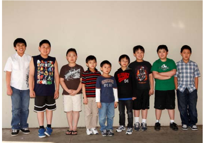
Mission Impossible team....