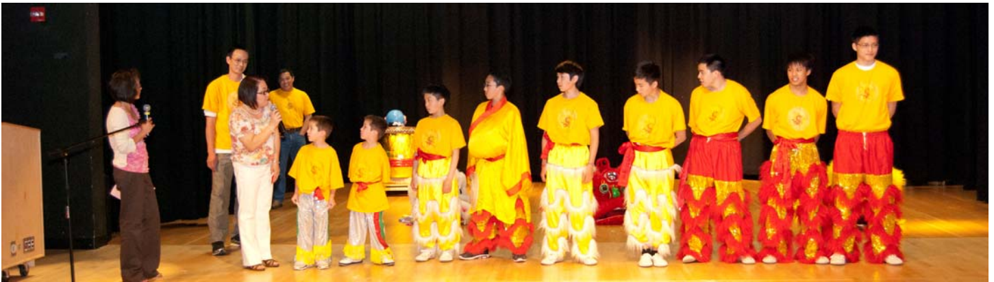
Đội múa lân “Phi Long” từ bé tới lớn gần chục em.