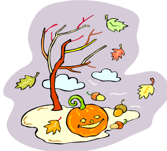
Mùa Thu có nhiều lá vàng rơi.

nhiều mưa và em thích mưa. Nhưng nếu mưa nhiều thì khó lái xe.